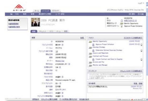
■プロジェクトオーバービュー画面イメージ 調達案件プロセスに関連するドキュメント・関連部署などが自動的に設定されます。